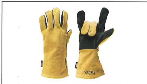
Feuerhandschuh Leder, Artikelnummer 030302

folgenden Normen und Verordnungen entspricht: